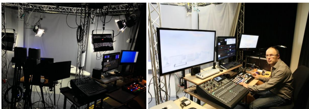
> Tournages en studio (Centre PMF)