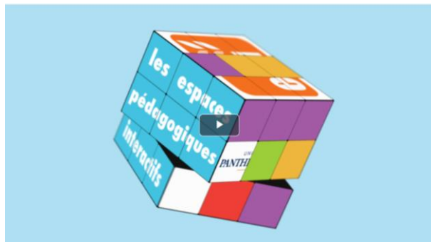
Les EPI - Espaces Pédagogiques Interactifs

Exemple : https://mediatheque.univ-paris1.fr/video/2659-les-epi-espaces-pedagogiques-interactifs/