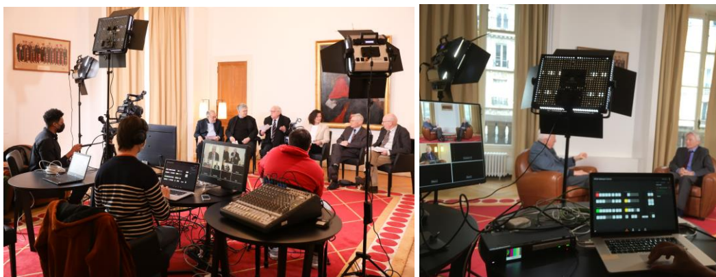
> Tournages au Centre Panthéon

Quelques exemples et images de tournages organisés par l'équipe audiovisuelle du SUN :