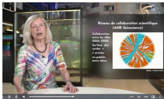
OOC_1.4 réseaux immatériels [5 septembre 2018]