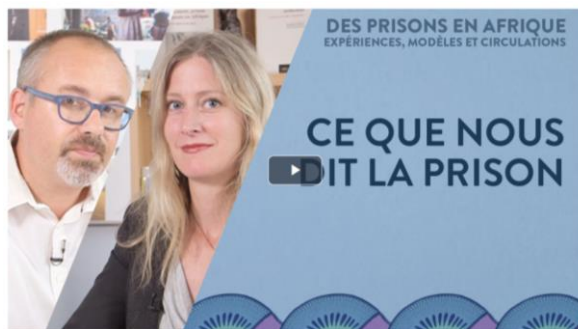
3.1 - Ce que nous dit la prison [11 janvier 2019]